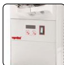
Versione ETC / ETC version